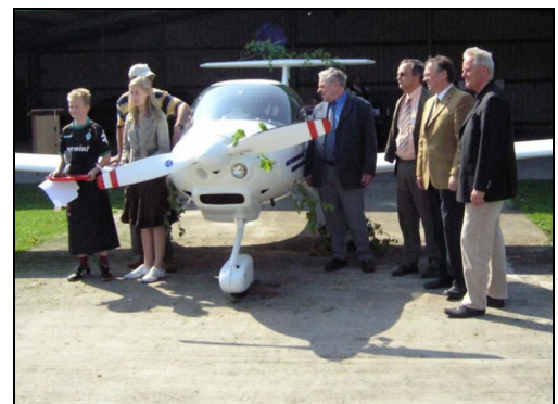
Flugzeugtaufe beim Luftsportclub