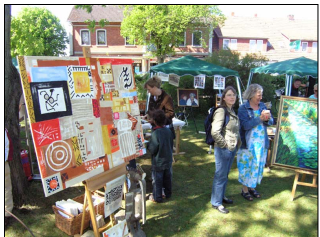
„Ein Dorf stellt sich vor 2007“

Das jährlich stattfindende Schützenfest, das Erntefest und die Dorfmesse „Ein Dorf stellt sich vor“ im Mai, mit nahezu allen Vereinen und vielen Produkten aus Gastronomie, Handwerk und Kunsthandwerk und das alle zwei Jahre stattfindende Gemeindefest der Kirchengemeinde sind Ausdruck einer lebendigen Dorfgemeinschaft.