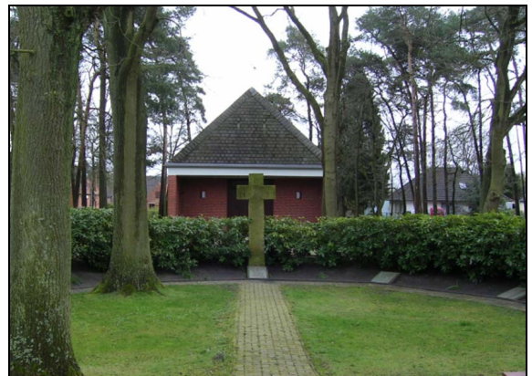
Ehrenmal in Hüttenbusch

Die Verkehrsanbindung, hat sich in jüngster Vergangenheit verbessert. Es fahren Busse bis zum Bremer Hauptbahnhof. Am Wochenende fährt zudem der Moorexpress vom neuen Bahnsteig.