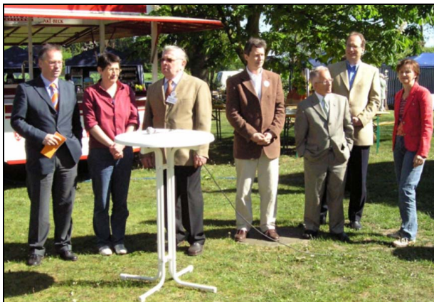
Eröffnung von „Ein Dorf stellt sich vor 2007“

Das steigende Angebot von Privatunterkünften unterstreicht die Attraktivität des Ortes für Feriengäste.