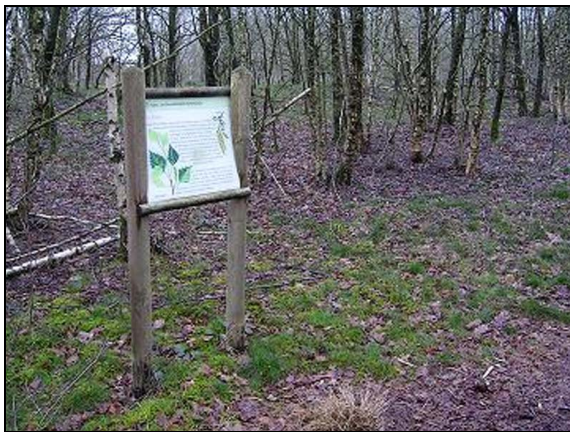
Natur- und Geschichtspfad

Unsere lokale Agendagruppe hat zusammen mit der Biologischen Station Osterholz einen Bereich mit Moor-Heide-Wald Landschaft sowie Ruinen eines Reichsarbeitsdienstlagers der Öffentlichkeit zugänglich gemacht.