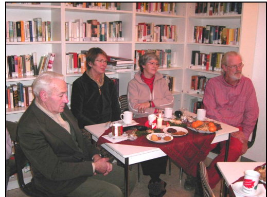
Büchercafé des Dorfplatz Hüttenbusch e.V.