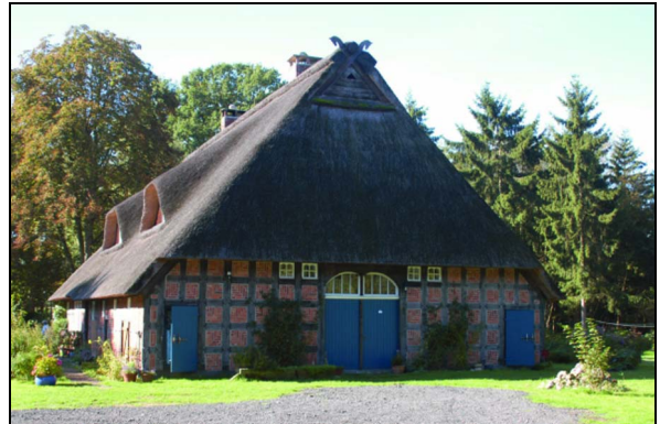
Heudorfer Straße 6