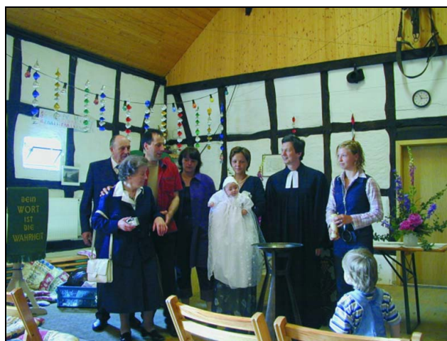
Taufe während des plattdeutschen Gottesdienstes im Jahr 2002 in Blumeyers Scheune, dem Vereinsheim des Heimatvereins Heudorf

Ein Blick auf den Hüttenbuscher Veranstaltungskalender, der auch im Internet verfügbar ist, macht deutlich, wie umfangreich das Angebot der Einrichtungen, der Vereine und Verbände und der Kirche ist.