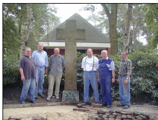
„Die rüstigen Rentner“ im Einsatz