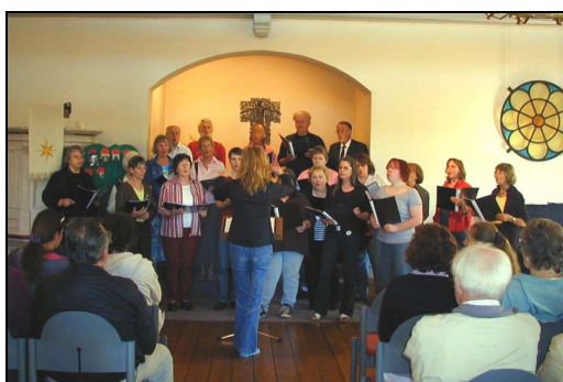
Singkreis Moorpieper während eines Konzertes