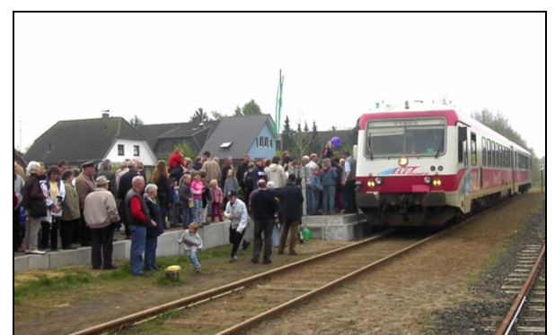
Bahnsteigfest zur Einweihung