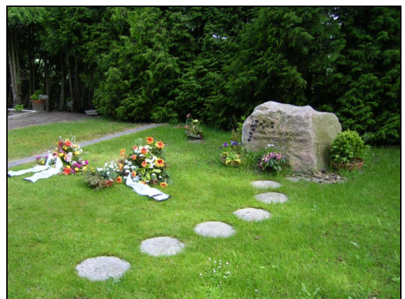
Urnefeld mit Gedenkstein