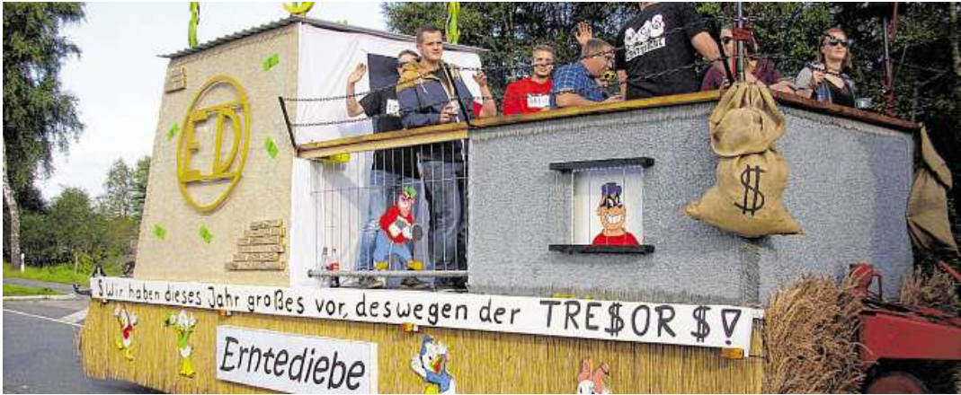
Die Hüttenbuscher Erntediebe nehmen Sonnabend mit ihrem aktuellen Erntewagen am Umzug teil.