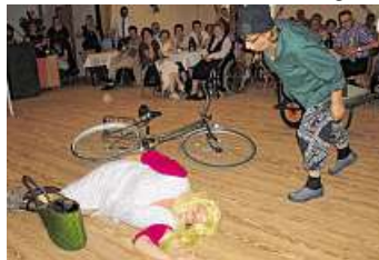
Wenn die „Quasselstrippen“ am Bunter Nachmittag ihren Auftritt haben, bleibt im Saal kein Auge trocken.