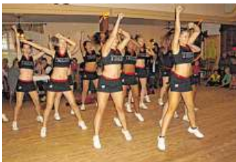
Ein Wiedersehen gibt es am Sonntag mit den Cheerleaders-Tigers vom TSV Lesum-Burgdamm.

Zu den Klängen von DJ Uwe nimmt das Volksfest einen harmonischen Ausklang. JSC