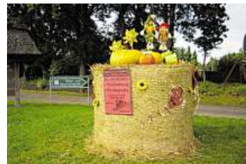
Diese lustigen Figuren auf einem Strohhallen weisen an der Einmündung des Mühlendamms in die Hüttenbuscher Straße auf das Erntefest hin.